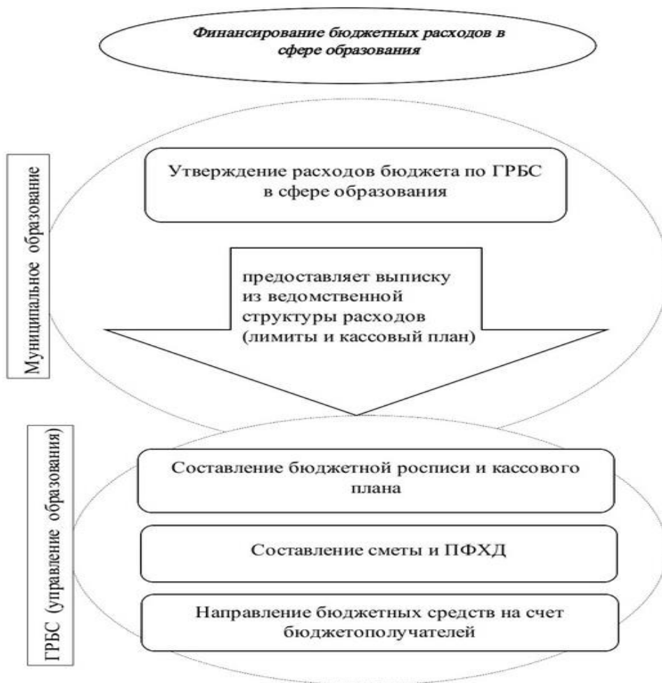
Рисунок 1 – Процесс финансирования расходов бюджета в сфере образования на примере МО

В смете бюджетного учреждения отражаются: реквизиты учреждения, свод расходов, свод доходов (финансирование из бюджетов; дополнительные платные услуги населению; оказание услуг по договорам с организациями; прочие поступления), производственные показатели учреждения, расчеты и обоснования расходов и доходов.